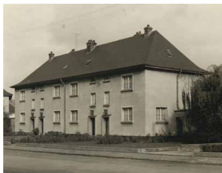
Maisons ouvrières au Brill, Dudelange (1948)