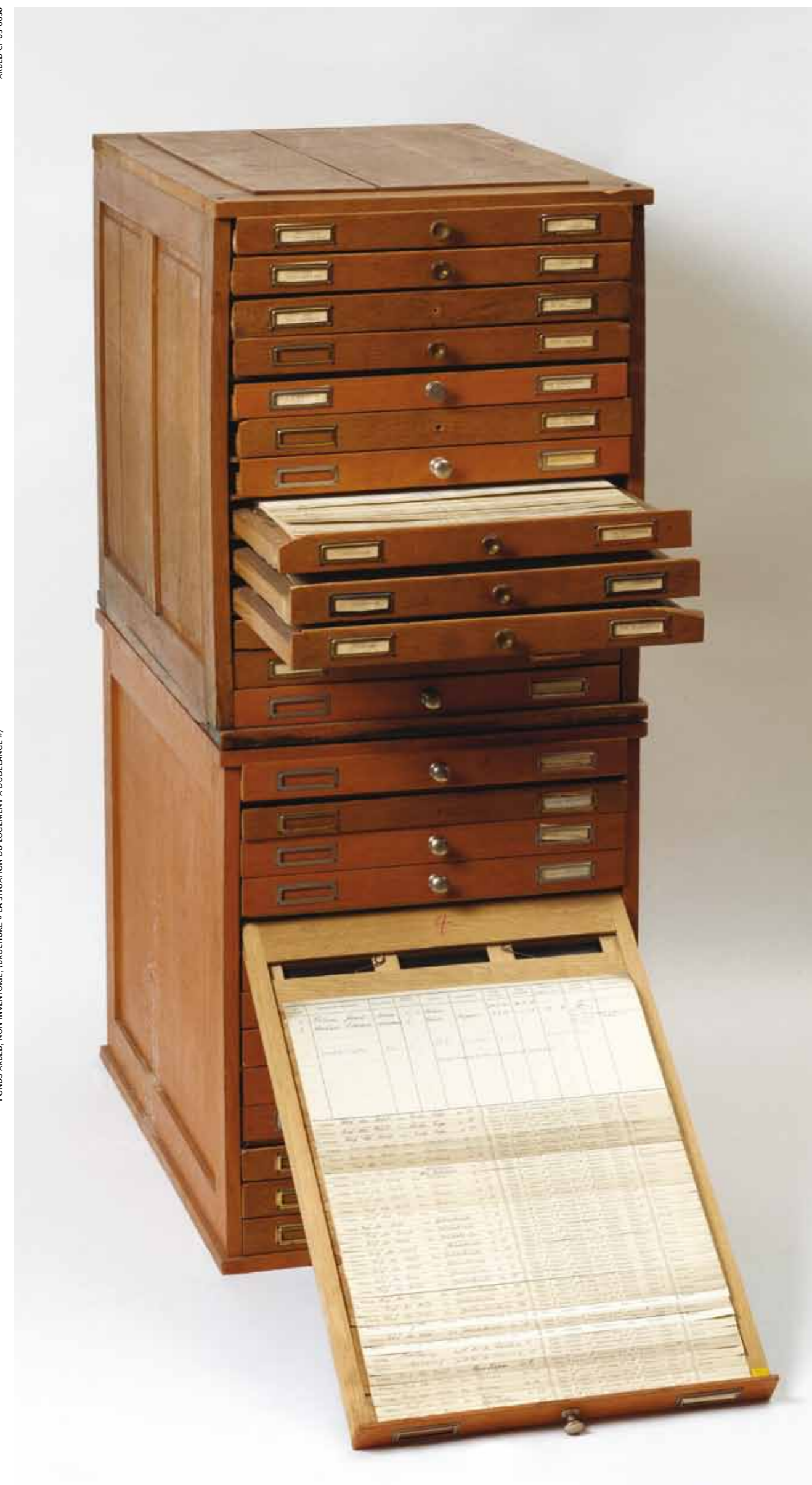
Fichier reprenant les maisons construites par l'Arbed et vendues dans les années 1970, s.d.