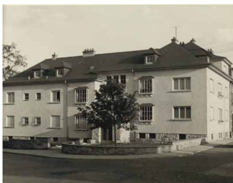
Maison à quatre appartements pour ingénieurs, rue de la Liberté, Dudelange (1952)

Avec son projet CARTE BLANCHE, l'hebdomadaire woxx met ses pages centrales à disposition des instituts culturels luxembourgeois. Pendant six éditions, ils peuvent disposer librement de cet espace pour offrir un aperçu de leurs collections.