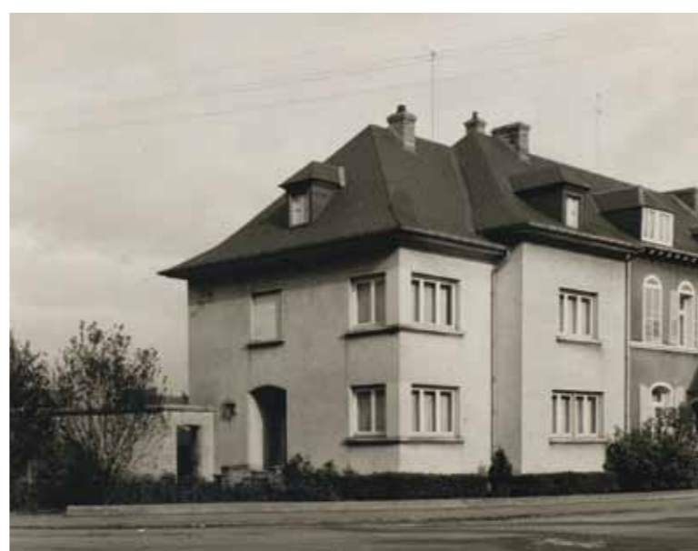
Maison d'ingénieur au Brill, Dudelange (1948)