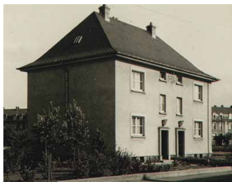
Maison ouvrière au Brill, Dudelange (1948)